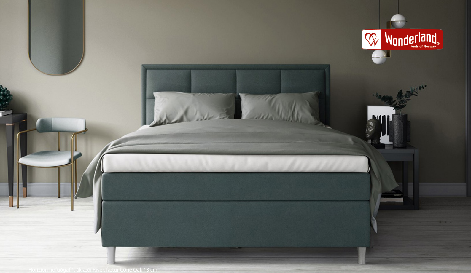
Horizon höfuðgafi*, áklæði River, fætur Cone Oak 13 cm